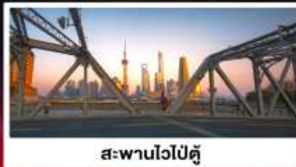
สะพานไวปู้ตู่