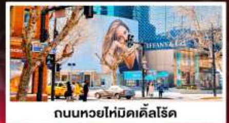
ถนนหยอไห่มีดิสโลด