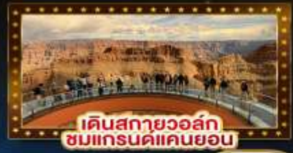
เดินสกายวอล์ก ชมแกรนด์แคนยอน