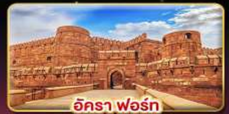
อัครา ฟอรั่ม